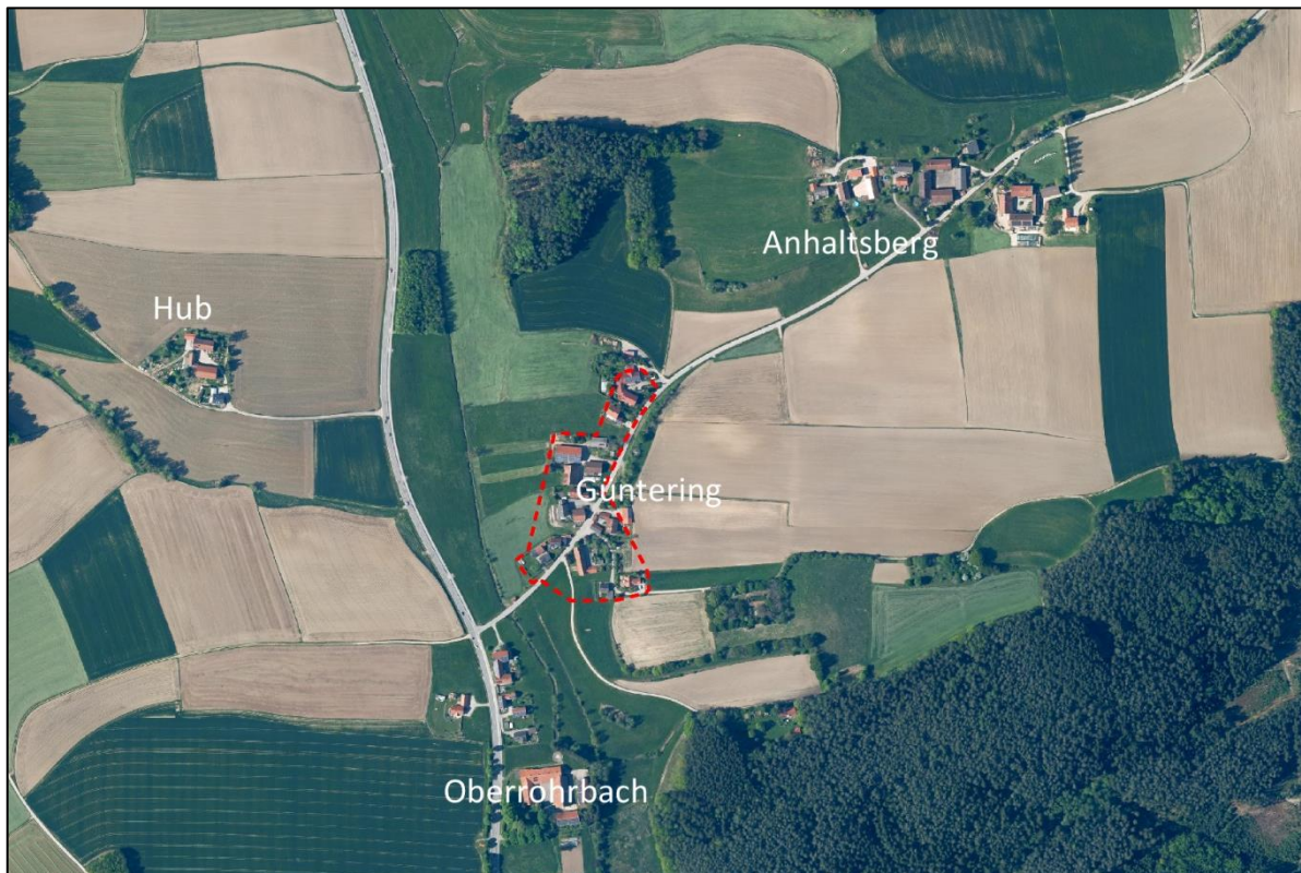
Abb. 1 Umgriff mit Geltungsbereich der Außenbereichssatzung für den Ortsteil Güntering vom 11.08.1994 im Luftbild (rot). Ohne Maßstab.

Das Satzungsgebiet liegt im Landkreis Altötting, im westlichsten Ausläufer der Gemeinde Pleiskirchen – in der Ortschaft Güntering. Das Plangebiet ist überwiegend mit Wohnbebauung und landwirtschaftlichen Hofstellen bebaut. Umgeben wird die Bebauung hauptsächlich von landwirtschaftlich genutzten Flächen.